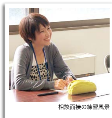
相談面接の練習風景

私 は、社会福祉士と精神保健福祉士の資格取得を目指しています。 三年生になり、この秋に一ヶ月間の社会福祉実習を行います。実習先は、医療機関です。現在は、医療機関で働く社会福祉士の業務内容やソーシャルワークについて、これまで学んできたことをテキストやノートをみて、整理しています。また、この実習で何を学ぶのか、テーマを決め、自分自身の課題を具体的に挙げながら、事前学習を進めています。実習を行うにあたって、戸惑いや不安はありますが、利用者さんの声に耳を傾け、理解し、支援ができるよう頑張りたいと思っています。また、実習を通して、自分自身をも見つめ知る機会にしたいと思っています。 四年生では、夏に精神保健福祉実習があります。今回の実習で学んだことを次につなげ、夢を実現したいと思っています。