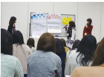
学生リーダーによる説明

私 は、四月九日、十日に行われたオリエンテーションキャンプに参加しました。 入学後すぐの泊りがけの行事で心配でしたが、先輩方が企画したゲームは友達をつくるきっかけになり、時間割の立て方の時には、自分なりの時間割を立てるために取りたい資格によって取得すべき単位の違いがあることや、四年間での最良の方法などを先輩方が一緒に考えてアドバイスしてくださいました。一人で難しく考え、詰め込みすぎだった時間割が余裕を持ったものになったと思います。友達をつくることや授業の取り方など、これからの大学生活における不安や疑問を解決する、とて