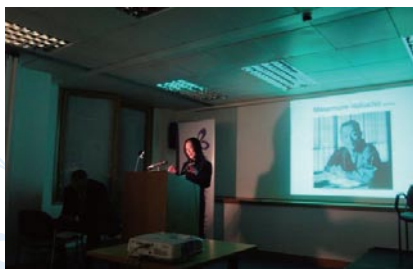
パネラーとして(The Japan Foundation London)