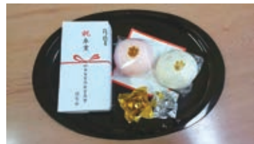
— 同窓会より 記念品 —

大学生活で学んだ多くの事を原動力に、益々のご活躍とご多幸を心よりお祈りいたします。